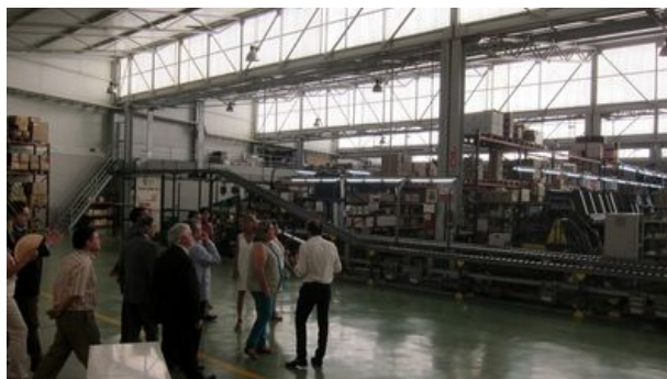
La cooperativa farmacéutica Jafarco facturó el pasado ejercicio 103 millones de euros

Son cifras que señalan lo que CEPES Andalucía define como "la cultura de la iniciativa". El sector sabe "diseñar las bases de un proyecto urbano que ha generado toda clase de iniciativas dentro de los más diversos sectores de la actividad económica", señala la organización de entidades de economía social.