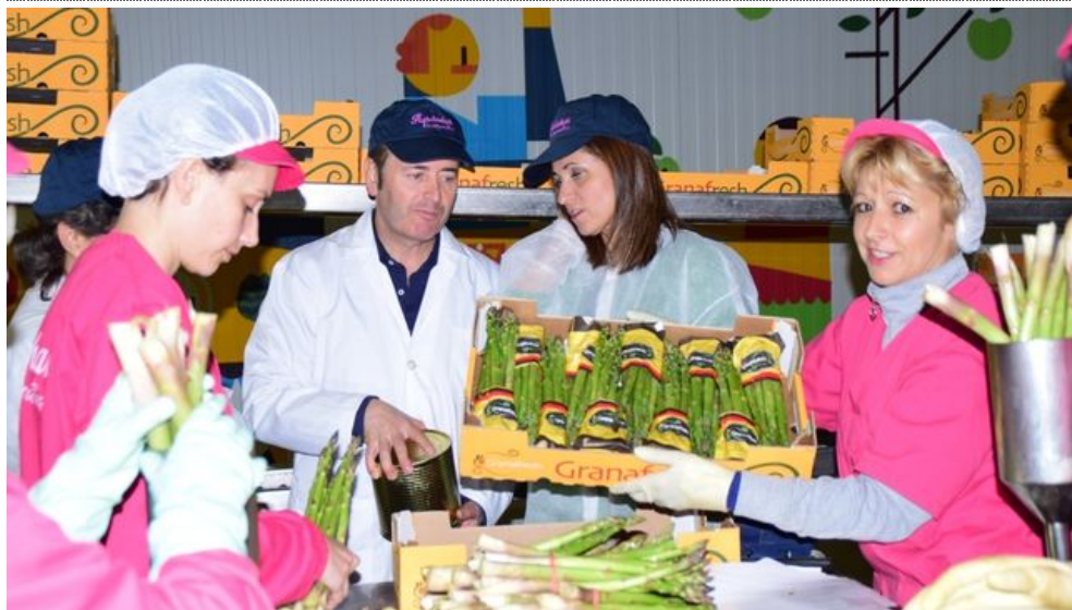
La Junta destina 211.000 euros a proyectos de modernización en la cooperativa Agroláchar

La economía social es un pilar del desarrollo en Andalucía. No es una sensación, no es una apuesta gubernamental o una aspiración empresarial. Así lo señalan las cifras.